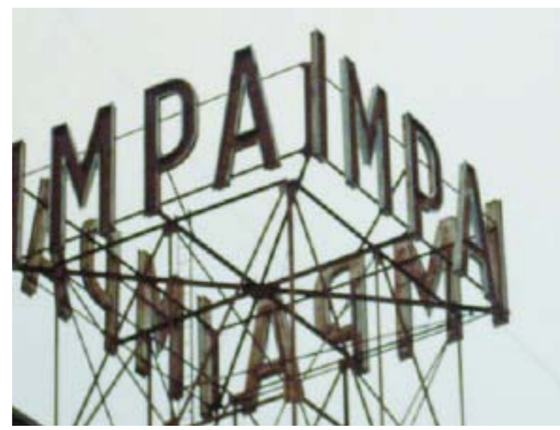
IMPA fábrica de forma

“Este cuento se dirige a la habilidad del lector que pone por sí mismo las cosas en escena.” | Mallarmé.