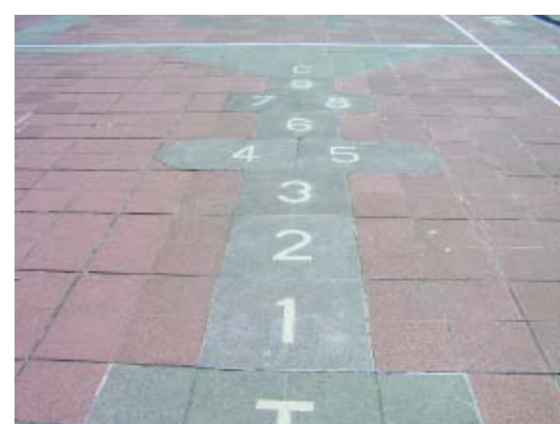
VAN GELDEREN objeto didáctico

presentar - actuar - transformar - mover - participar - sincronizar - comprometer - habitar - construir - percibir - representar